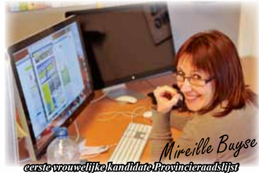
eerste vrouwelijke kandidate Provincieraadslijst