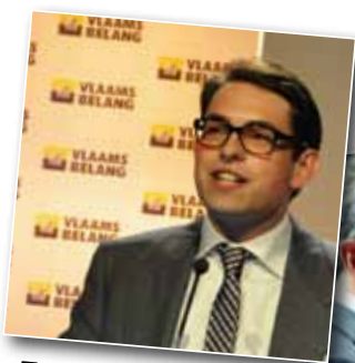
Tom Van Grieken