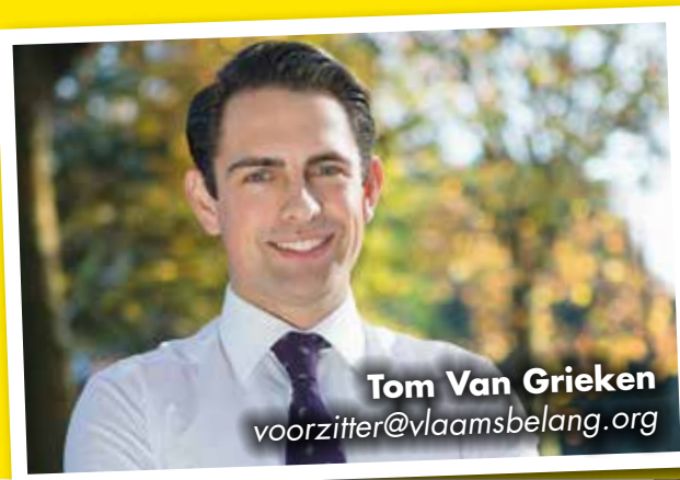
Tom Van Grieken voorzitter@vlaamsbelang.org

Politici die vandaag nog steeds halsstarrig weigeren om hier werk van te maken, zaaien zelf de kiemen van een volgende aanslag.