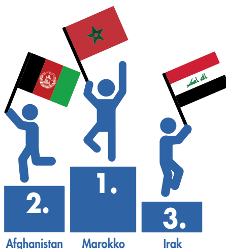
Top 3 toewijzingen aan niet EU-vreemdelingen (2016)

massaal een asielstatuut kregen toegekend nu massaal kandideren op de sociale woningmarkt.