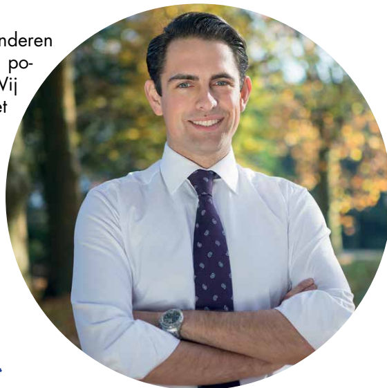
Tom Van Grieken Voorzitter

Met het Vlaams Belang maken we Vlaanderen weer van ons!