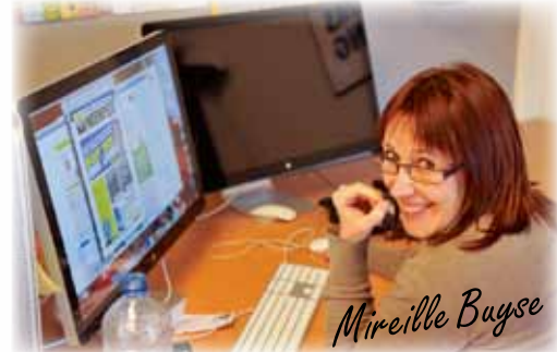
2de kandidaat Provincieraadslijst