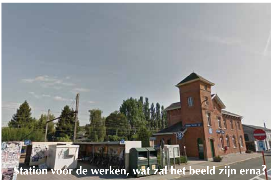
Station voor de werken, wat zal het beeld zijn erna?

schepen de werken aan de verhoging van het perron en eventueel nog "andere" zou tegenhouden omdat ze "te lang" zouden duren. Ongeloofwaardig omdat dergelijke werken steeds in afspraak (zouden) moeten zijn met de gemeentediensten. Of is het misschien eerder geloofwaardig dat het bestuur hier nu pas over wakker schoot. Meer zelfs, een schepen van openbare werken die de werken zou stilleggen, kan evengoed de tijd nemen om op een gepaste manier te zorgen voor compensaties voor de getroffen handelaars.