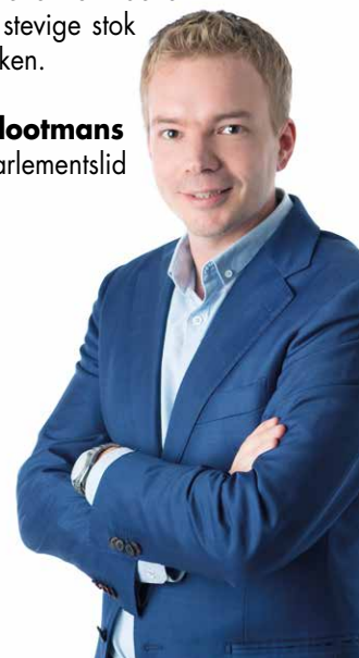
Klaas Sloomans Vlaams parlementslid

Wanneer Brussel toch doorzet met de stadstol, zal het Vlaams Belang alvast een belangenconflict indienen om deze pestbelasting een stevige stok in de wielen te steken.